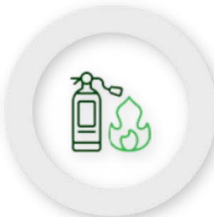
Combate a Incêndio