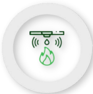
Detecção de Incêndio